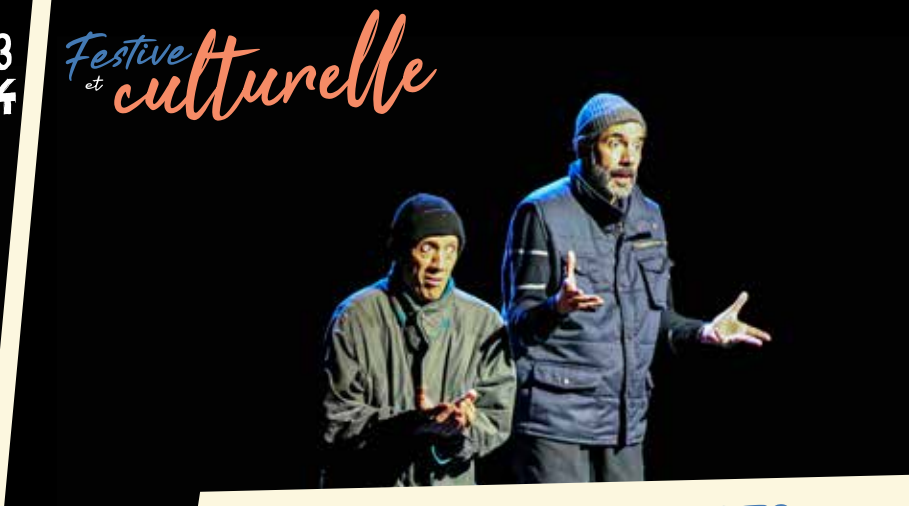
Théâtre | MIGRAAANTS