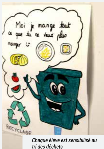
Chaque élève est sensibilisé au tri des déchets

La loi Egalim a engagé la restauration scolaire dans une démarche éco-citoyenne notamment dans la lutte contre le gaspillage alimentaire.