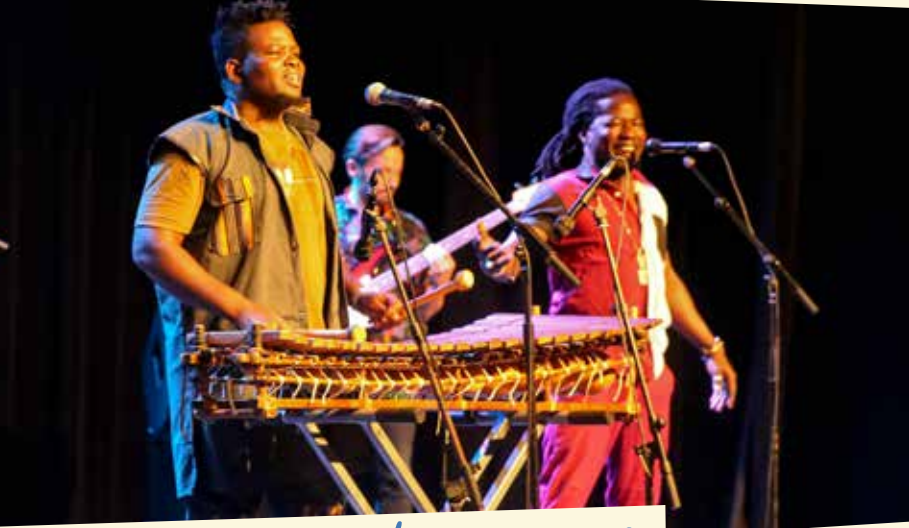
Concert | KANAZOÉ ORKESTRA