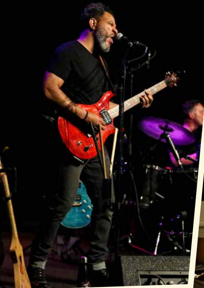
Concert | ELIASSE