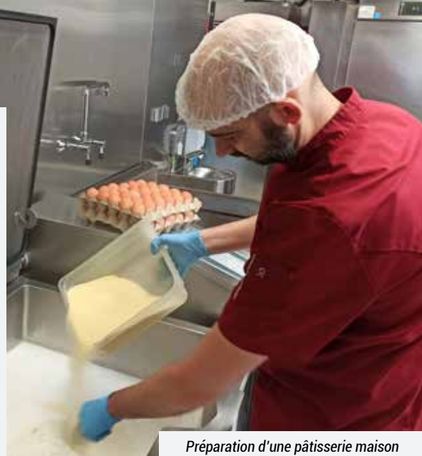
Préparation d'une pâtisserie maison